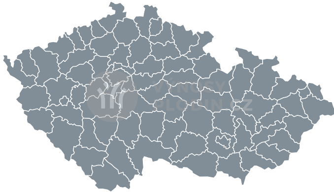
Nejistota odhadu [%]