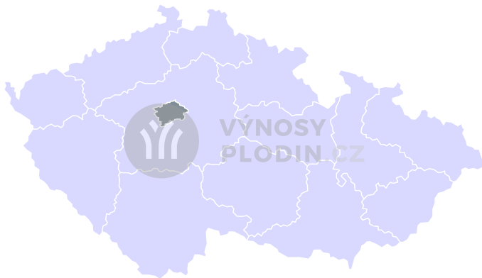
Nejistota odhadu [%]