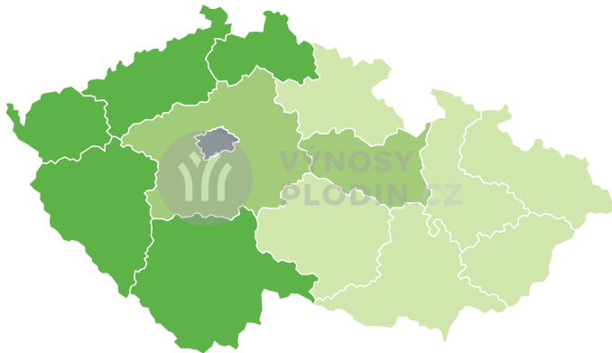
Odchylka výnosu [%]